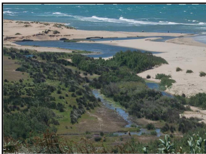
Plage de Réghaia

Les problèmes majeurs rencontrés dans la zone sont l'urbanisation illicite et précaire, les rejets urbains domestiques et industriels, l'envasement et la pollution du lac, le pompage de l'eau pour l'irrigation, l'extraction de sable, et la dégradation de la plage de sable. Une gestion intégrée de cette zone exige donc une approche hautement intersectorielle.