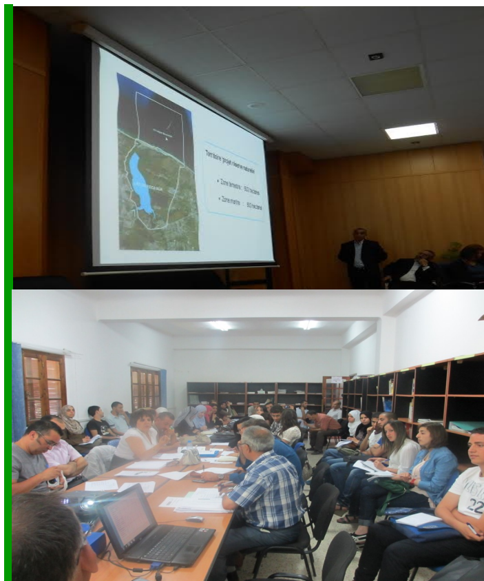
Atelier “ Imagine ” - centre cynégétique de Réghaia

MedPartnership Project UNEP/MAP Information Office 48, Vas Konstantinou Athens, 11635, Greece