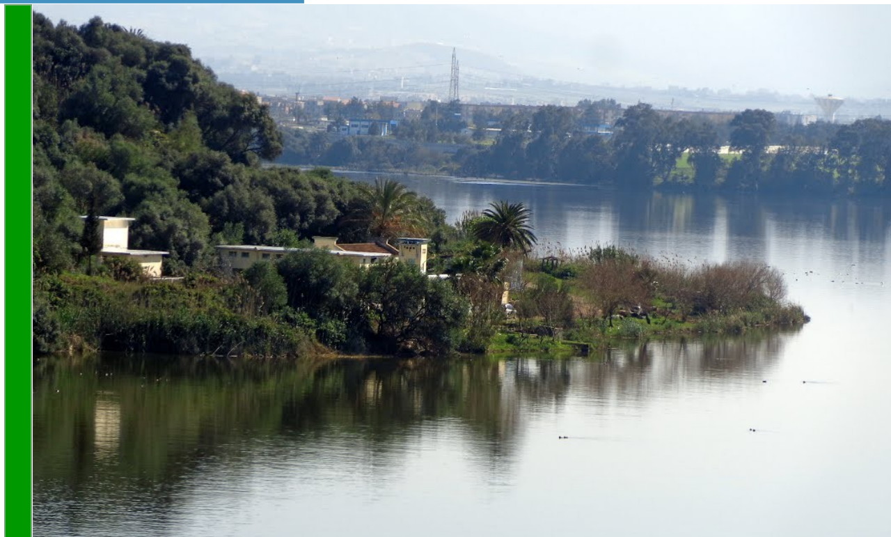
Vue du Lac de Réghaia; Photo: Fahed Chater